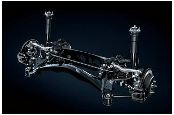
サスペンション（リヤ）