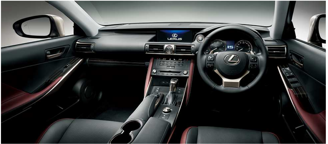
IS350“version L”（ニュアンスブラック） ＜オプション装着車＞