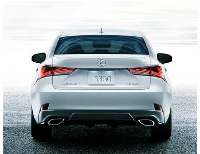
IS350“F SPORT” エクステリア <オプション装着車> (フロント、リヤ、サイド)