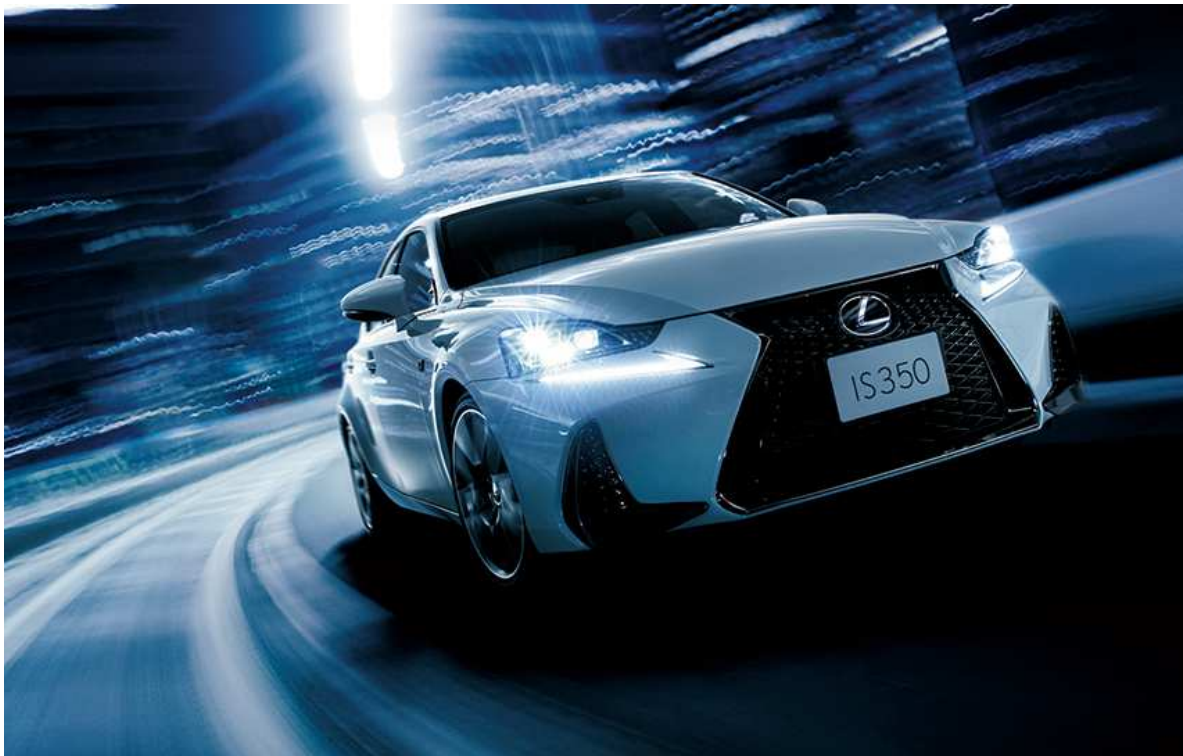
IS350 “F SPORT”（ホワイトノーヴァガラスフレーク） ＜オプション装着車＞

LEXUSは、IS350、IS300h、IS200tをマイナーチェンジし、全国のレクサス店を通じて10月20日に発売した。