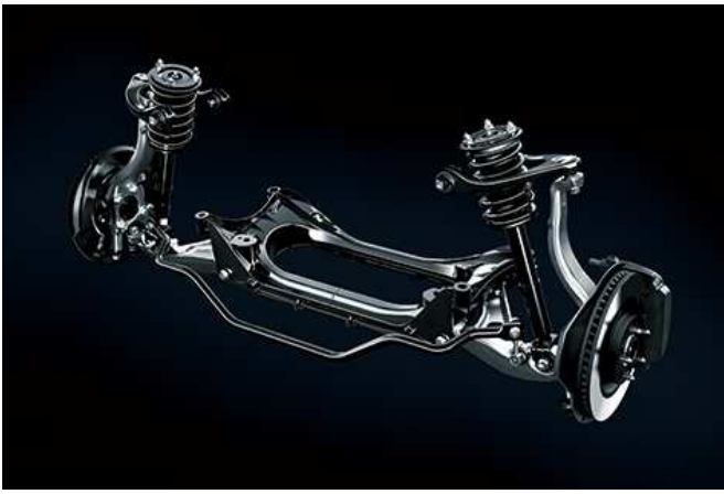
サスペンション（フロント）