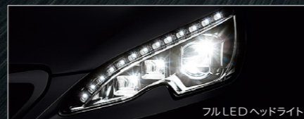
フルLEDヘッドライト

トラクションコントロール、スタビリティコントロール、ブレーキアシスト、アンチロックブレーキシステム、EBD(電子制御制動力分配機能)などの電子制御システムで構成されるアクティブセーフティプログラムが全車に標準装備されています。クルマがドライバーの意志に反して危険な姿勢に陥ったと判断された際に、各システムが連携しながら車体姿勢を補正し、ドライバーが意図したコースへと戻します。