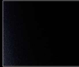
ペルラ・ネラ・ブラック