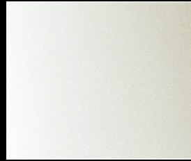
パール・ホワイト