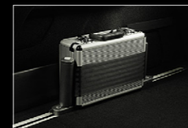
ラゲッジフックレール用 リトラクタブルストラップ(308 SW)