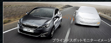
ブラインドスポットモニターイメージ

標準装備としては、このクラス初の採用です。ポジションランプ、ハイビーム、ロービームすべてLEDで構成され、明るさも照射範囲も大幅に向上。瞬時に反応するため