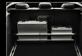
ラゲッジフックレール用 テレスコピックバー (308 SW)