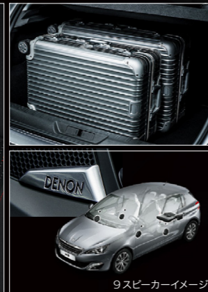
9スピーカーイメージ