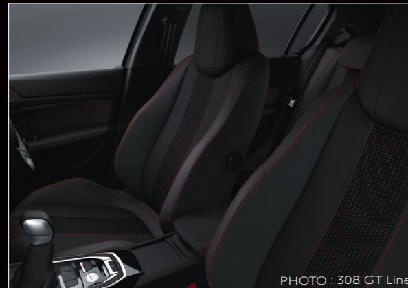
PHOTO : 308 GT Line

皮革本来の質感を醸す高級フルグレインレザー巻きの小径ステアリングホイール、ブラックを基調とするインテリアに効果的にあしらわれたサテンクロームやブラックラッカー仕上げのアクセントトリム。さらには個々の素材の精密なアッセンブリーが、室内の高級感を際立たせています。またシート素材は、Allureはファブリック、GT Lineはテップレザー&ファブリックを採用。GT Lineのステアリング、インテリア、シートには、鮮やかなレッドステッチが施されています。