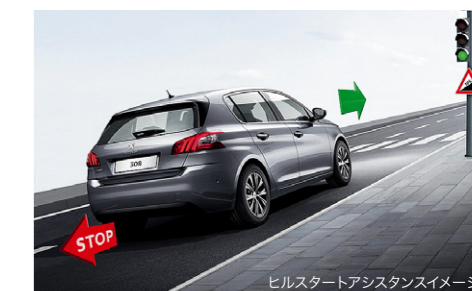
ヒルスタートアシスタンスイメージ

タイヤの回転情報をもとに、いずれかのタイヤ空気圧に大きな変化があった場合、マルチファンクションディスプレイに警告表示します。