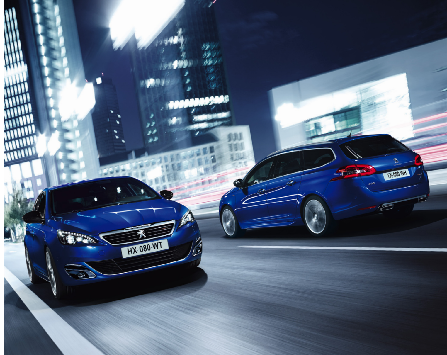
PEUGEOT 308/308 SW