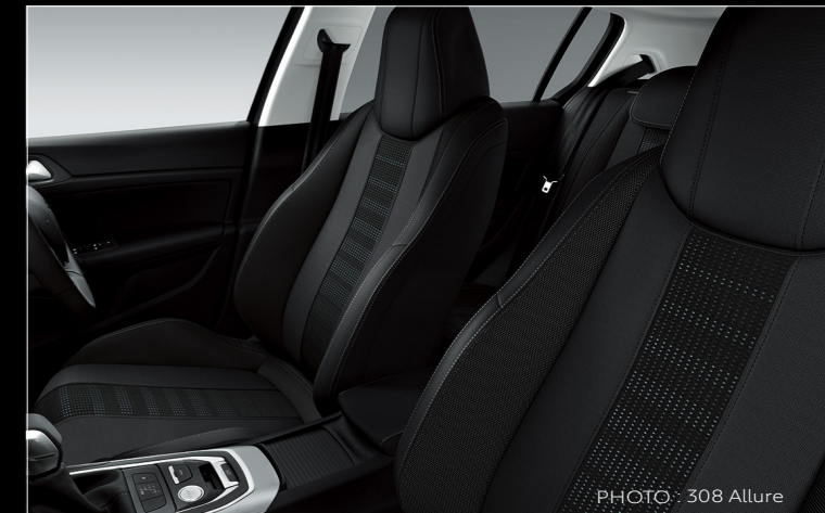
PHOTO : 308 Allure

上級装備に加え、ルーフレール、ラゲッジフックレールなどワゴンならではの装備を充実させた、ハイバリューワゴン。