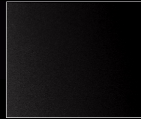
ハリケーン・グレー