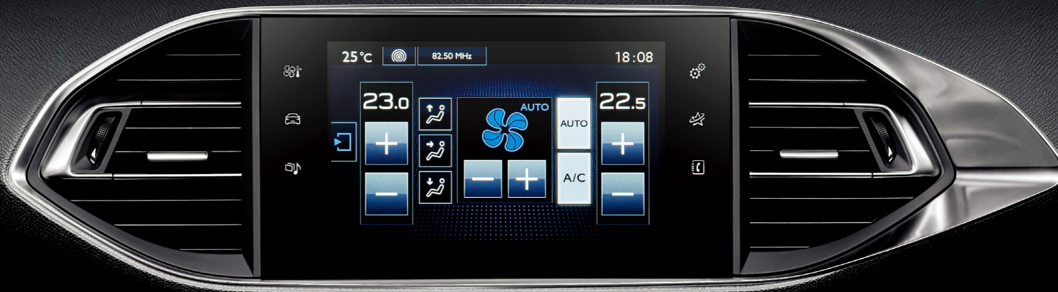
PHOTO : 308 Allure