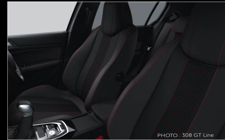
PHOTO : 308 GT Line