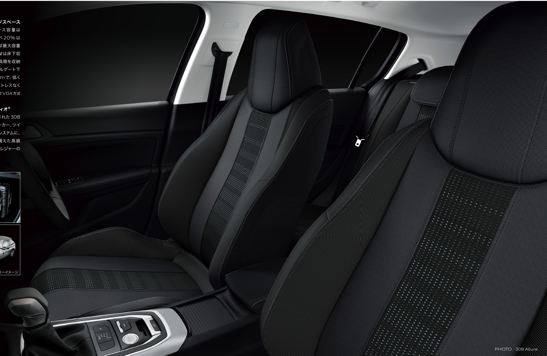
PHOTO : 308 Allure