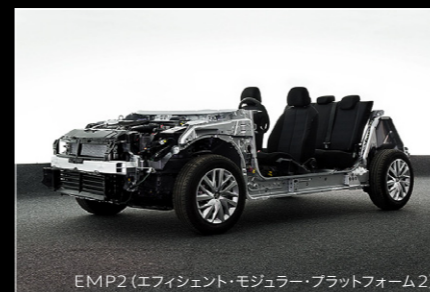
EMP2 (エフィシエント・モジュラー・プラットフォーム2)

最高出力96kW(130ps)/5,500rpm、最大トルク230Nm/1,750rpm。小排気量ながら200バールの高圧燃料噴射システムによって極めて高い燃焼効率を実現。1,750rpmという低回転域から、1.6ℓの自然吸気エンジンをも上回る強大なトルク*を発生。同時に優れた燃費性能も併せ持っています。また軽量でコンパクトなサイズも大きな特長です。1.6ℓ 4気筒自然吸気エンジンに比べ-12kgの単体重量*は優れた回頭性を生み、ボディの軽量化にも大きな役割を果たしています。 *当社比