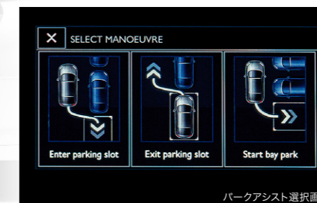
パークアシスト選択画面

※すべての操作をクルマが自動で行うわけではありません。運転する方は常に十分な安全確認を行い、状況に応じて駐車プロセスを中断するなどの判断が必要です。