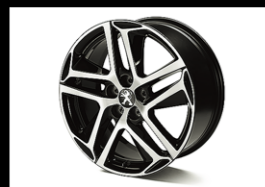
18インチアロイホイール SAPHIR BLACK