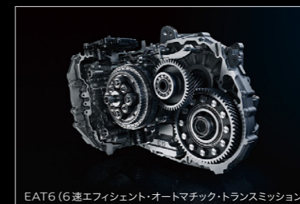
EAT6 (6速エフィシエント・オートマチック・トランスミッション)

308 & 308 SWには最新の6速AT、EAT6 (6速エフィシエント・オートマチック・トランスミッション)を搭載。ギヤレシオをハイギヤード化することで同一速度域でのエンジン回転を下げ、新開発のクラッチによってロックアップ領域を拡大、トルクコンバーターのスリップ