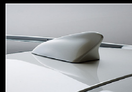
ドルフィンアンテナ