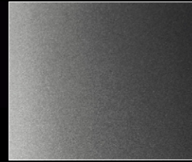
アルタンス・グレー