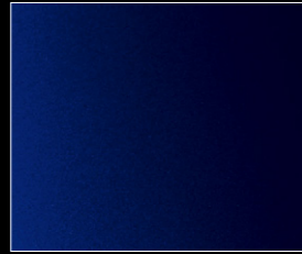
マグネティック・ブルー