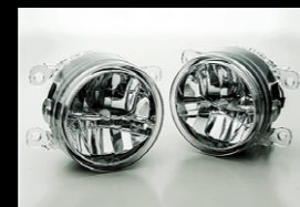
LEDフォグランプキット